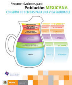
(Secretaría de Salud, 2016)

Por lo que se refiere al Aspecto Psicosocial debes procurar estar atento a los cambios que se pueden presentar en tu estado anímico como resultado de estar bajo presión, mantener una postura clara y respetuosa ante los demás, es decir, respetar la opinión, pero reflexionar en qué tan válida es y, sobre todo, si debes realizar algún cambio en tu propio comportamiento.