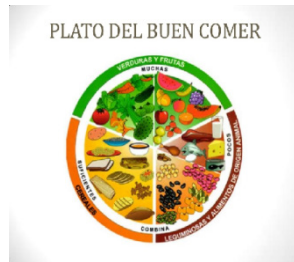
(Secretaría de Salud, 2016)

En cuanto a la alimentación es conveniente puntualizar algunas recomendaciones: Es importante que comas de forma balanceada y nutritiva, sin omitir revisar el plato del buen comer y la jarra del buen beber, ambos esquemas emitidos por la Secretaría de Salud.